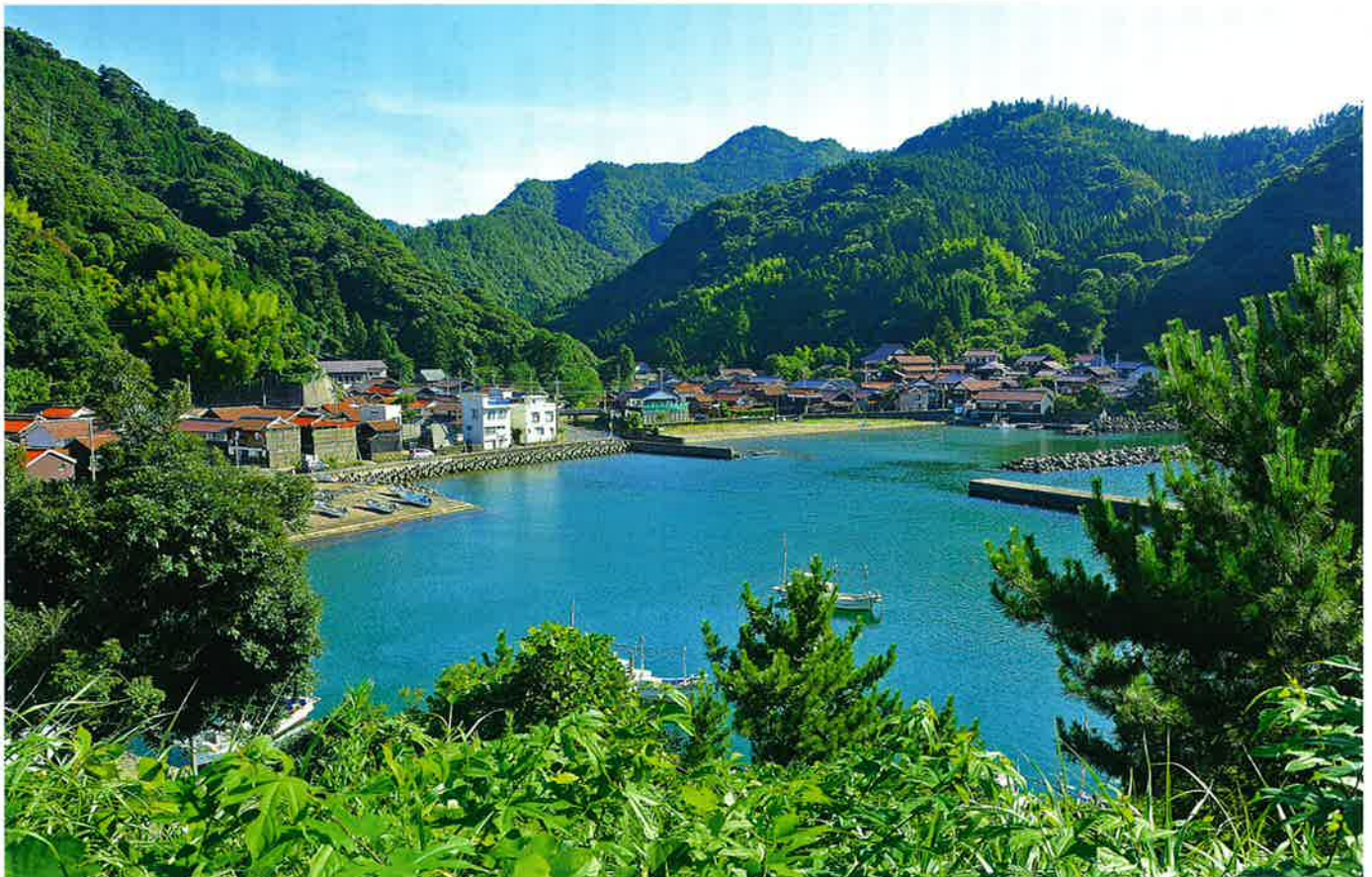
鷺浦集落のトンネル手前墓地より撮影

中央白い建物の右後方に「伊奈西波岐神社」がある。（鷺浦地区については3ページ参照）